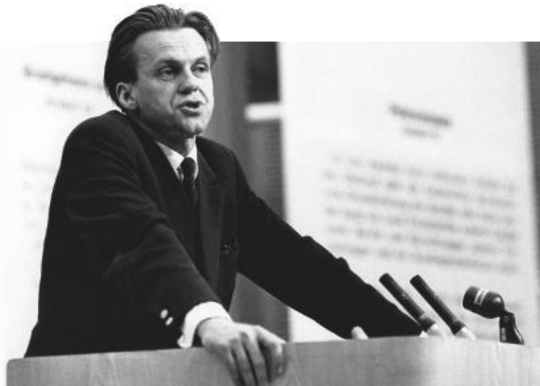
Wort als Lebensmittel Walter Jens lebte für und in der Sprache. Mit seinen Reden – so wie hier im Großen Sendesaal des Hessischen Rundfunks 1968 – zog er Menschen in seinen Bann

Gegen Mittag hört man Wasser im Bad neben dem Schlafzimmer rauschen, dazwischen die Proteste von Walter Jens, der offenbar nicht duschen will. Doch bald darauf sitzt er frisch gekämmt und angezogen im Esszimmer bei seiner